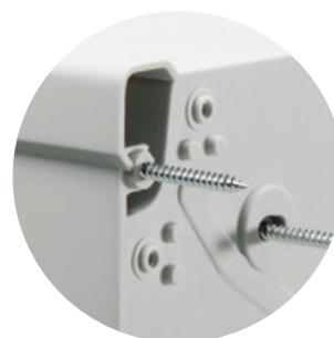
Różne możliwości montażu na ścianie