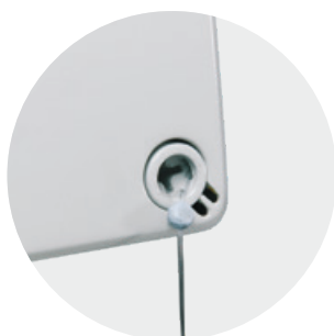
Możliwość plombowania pokryw