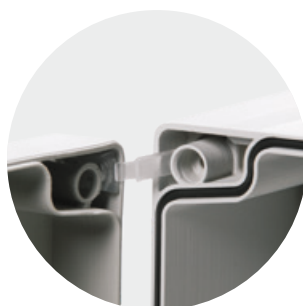
Błyskawicznie montowane zawiasy