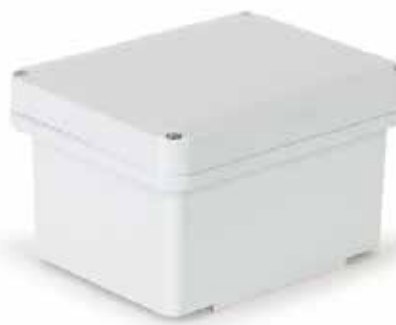
W pełni ścigana pokrywa, zamykana na 4-śruby