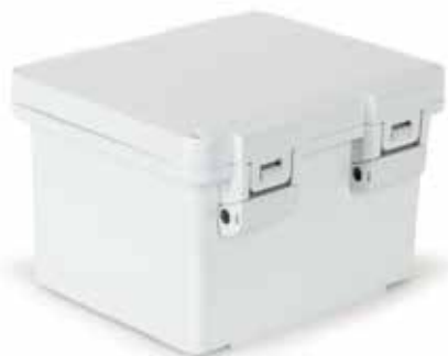
Z zawiasami, zamknięcie poprzez zatrzaski z tworzywa (HNL)