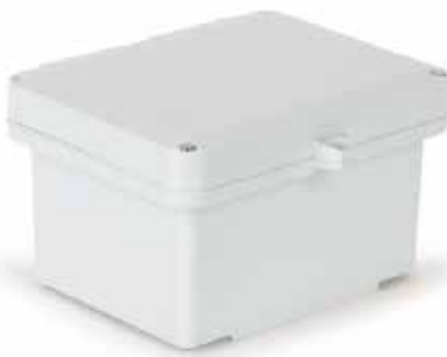
Z zawiasami, zamknięcie na 2-śruby, uchwyt na kłódkę (HS)