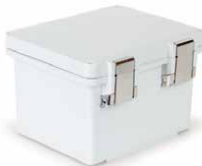
Z zawiasami, zamknięcie zatrzaskami metalowymi (HML)