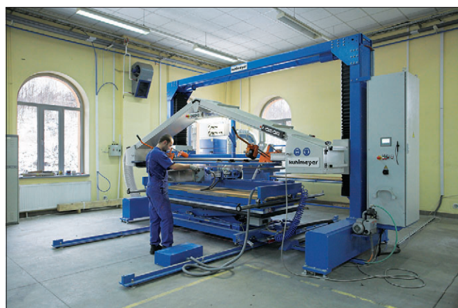
Szlifierka do powierzchni nierdzewnych