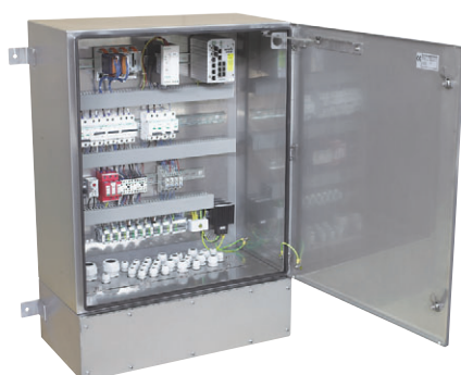
Szafki nierdzewne z wyposażeniem elektrycznym, wykonane zgodnie z projektem dostarczonym przez klienta