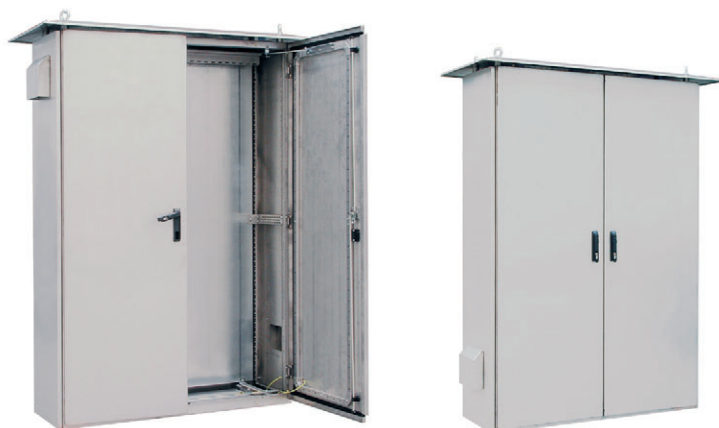
Szafy energetyczne ze stali nierdzewnej, montowane do dźwigów portowych