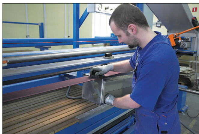
Obróbka spawów na korpusie szafki ze stali nierdzewnej