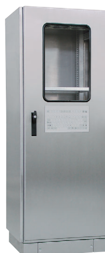
Szafa energetyczna SZE2 w wykonaniu specjalnym ze stali nierdzewnej