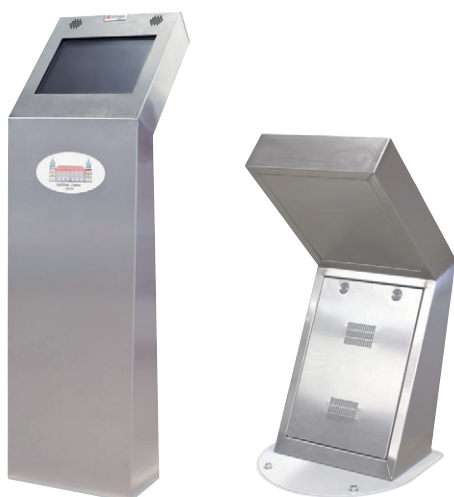
Infokioski ze stali nierdzewnej