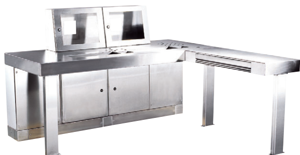
Pulpit dyspozytorski ze stali nierdzewnej dla przemysłu chemicznego